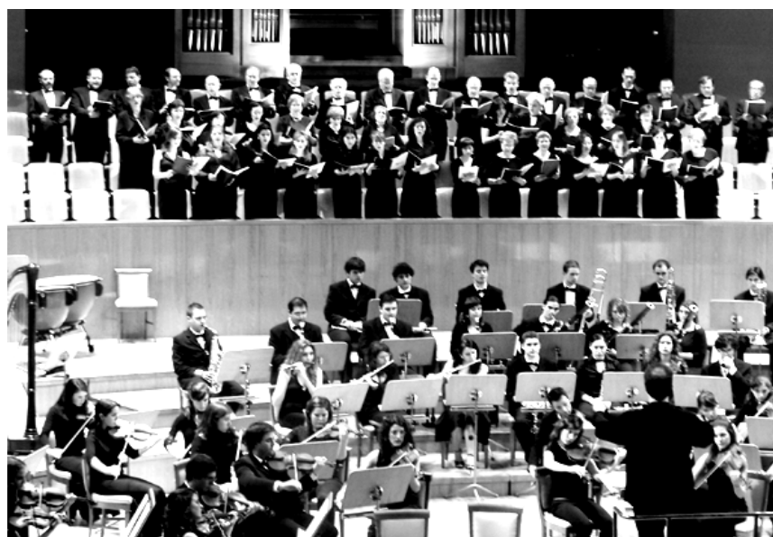
La Sociedad Lírica Complutense en el Auditorio Nacional de Música

El Coro de la " Sociedad Lírica Complutense " tiene su sede en la histórica ciudad universitaria de Alcalá de Henares (la romana Complutum), localidad que viera nacer en 1547 a Miguel de Cervantes Saavedra y que, desde el año 1998, ostenta el título de " Ciudad Patrimonio de la Humanidad ", otorgado por la UNESCO.